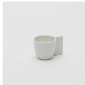
PN: CM/003 Name: Espresso Cup Color: White Size: φ50 W70 H44 Price: ¥1,300