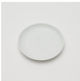
PN: CM/008 Name: Plate 140 Color: Sprinkles Size: φ132 H17 Price: ¥1,900