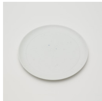
PN: CM/012 Name: Plate 220 Color: Sprinkles Size: φ220 H17 Price: ¥5,500