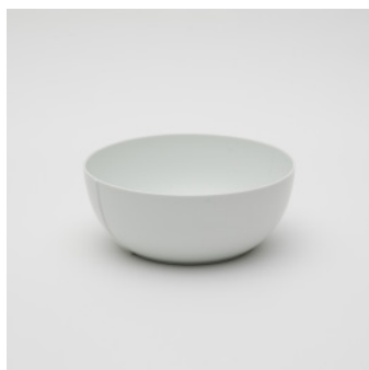
PN: CM/016 Name: Bowl 200 Color: Sprinkles Size: φ200 H80 Price: ¥6,900