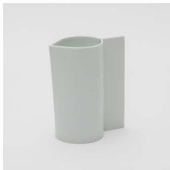
PN: CM/020 Name: Pitcher Color: Sprinkles Size: \phi 80.5 W117 H140 Price: ¥10,000