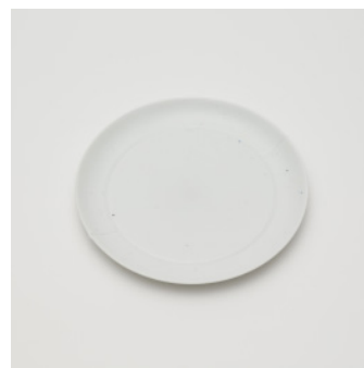
PN: CM/009 Name: Plate 180 Color: White Size: φ180 H17 Price: ¥2,500