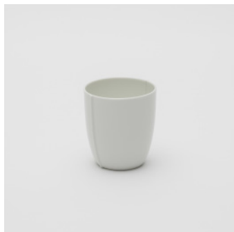
PN: CM/001 Name: Cup Color: White Size: φ70 H78 Price: ¥1,300