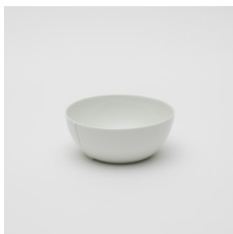
PN: CM/013 Name: Bowl 140 Color: White Size: φ140 H55 Price: ¥2,400