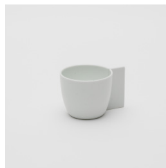
PN: CM/006 Name: Coffee Cup Color: Sprinkles Size: φ70 W95 H58 Price: ¥2,500