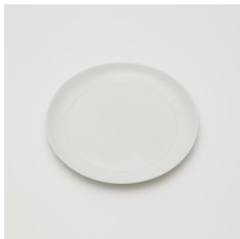
PN: CM/010 Name: Plate 180 Color: Sprinkles Size: φ180 H17 Price: ¥3,700