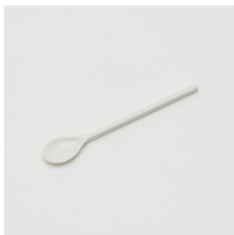
PN: CM/017 Name: Spoon Color: White Size: W18 D110 H5 Price: ¥1,000