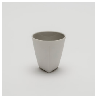
PN: CH/005 Name: Coffee Cup Color: Gray Size: \phi 85 H85