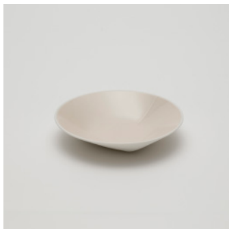
PN: CH/023 Name: Deep Plate 150 Color: Pink Size: \phi 150 H30