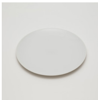
PN: CH/017 Name: Plate 270 Color: White Size: \phi 270 H21