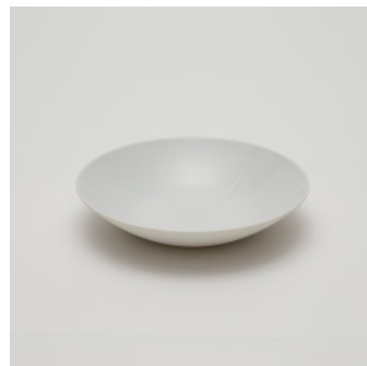
PN: CH/024 Name: Deep Plate 180 Color: White Size: \phi 180 H35