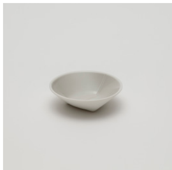
PN: CH/019 Name: Deep Plate 90 Color: Gray Size: \phi 90 H25