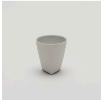
PN: CH/001 Name: Espresso Cup Color: White Size: \phi 60 H65