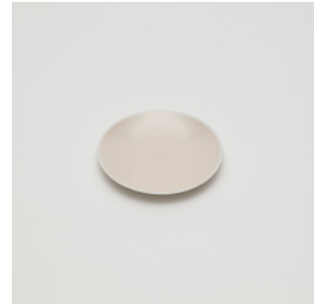
PN: CH/012 Name: Plate 120 Color: Pink Size: \phi 120 H15