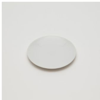
PN: CH/013 Name: Plate 150 Color: White Size: \phi 150 H15