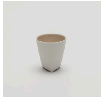
PN: CH/003 Name: Espresso Cup Color: Pink Size: \phi 60 H65