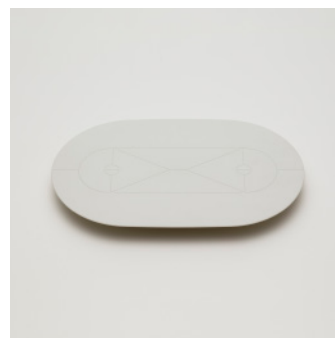
PN: CH/036 Name: Serving Tray Color: White Size: W285 D180 H25