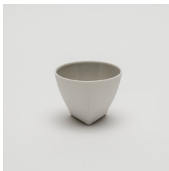
PN: CH/008 Name: Tea Cup Color: Gray Size: \phi 90 H70