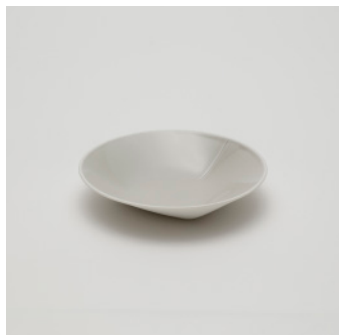
PN: CH/022 Name: Deep Plate 150 Color: Gray Size: \phi 150 H30