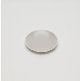
PN: CH/011 Name: Plate 120 Color: Gray Size: \phi 120 H15