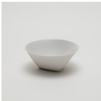
PN: CH/029 Name: Bowl 150 Color: White Size: \phi 150 H60