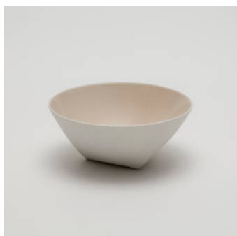
PN: CH/034 Name: Bowl 180 Color: Pink Size: \phi 180 H75