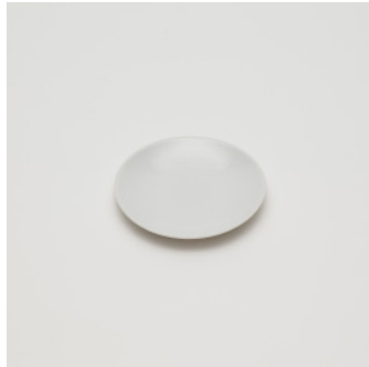
PN: CH/010 Name: Plate 120 Color: White Size: \phi 120 H15