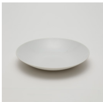
PN: CH/025 Name: Deep Plate 240 Color: White Size: \phi 240 H39