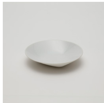
PN: CH/021 Name: Deep Plate 150 Color: White Size: \phi 150 H30