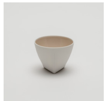
PN: CH/009 Name: Tea Cup Color: Pink Size: \phi 90 H70