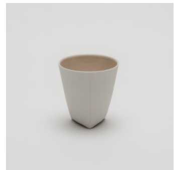
PN: CH/006 Name: Coffee Cup Color: Pink Size: \phi 85 H85