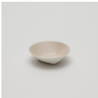
PN: CH/020 Name: Deep Plate 90 Color: Pink Size: \phi 90 H25