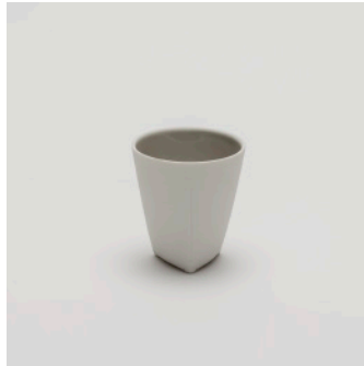
PN: CH/002 Name: Espresso Cup Color: Gray Size: \phi 60 H65