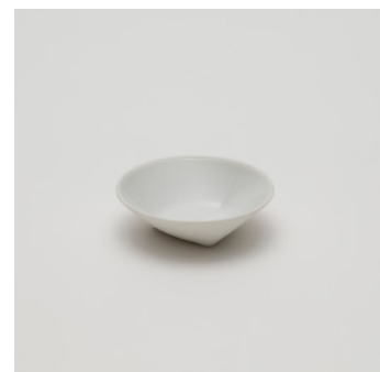
PN: CH/018 Name: Deep Plate 90 Color: White Size: \phi 90 H25