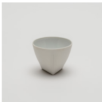
PN: CH/007 Name: Tea Cup Color: White Size: \phi 90 H70