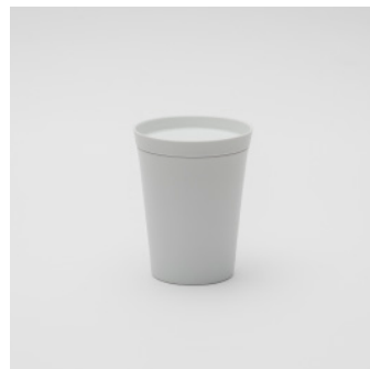
PN: IR/012 Name: Tea Container Color: White Matt Size: \phi 107 H136