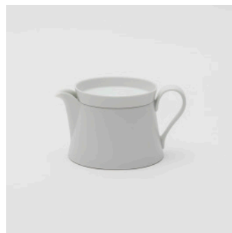
PN: IR/015 Name: Tea Pot S Color: White Matt Size: \phi 110 W150 H85