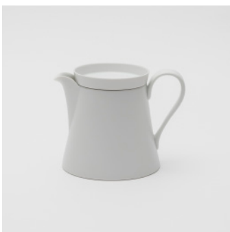
PN: IR/017 Name: Tea Pot L Color: White Matt Size: \phi 125 W165 H125