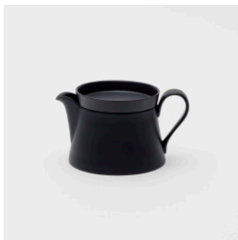
PN: IR/014 Name: Tea Pot S Color: Black Matt Size: \phi 110 W150 H85