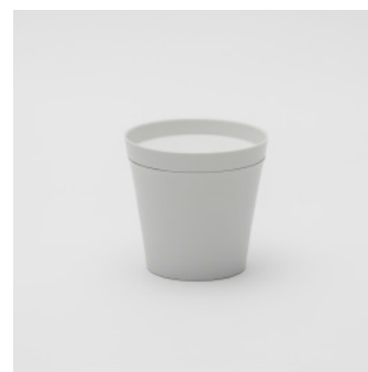
PN: IR/006 Name: Tea Cup L Color: White Matt Size: \phi 105 H100