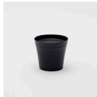
PN: IR/003 Name: Tea Cup M Color: Black Matt Size: \phi 95 H85