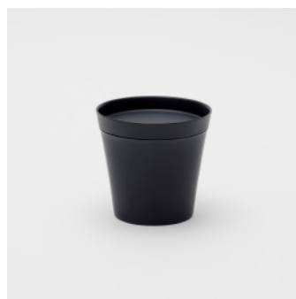
PN: IR/005 Name: Tea Cup L Color: Black Matt Size: \phi 105 H100