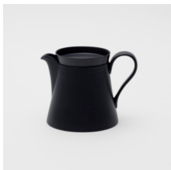
PN: IR/016 Name: Tea Pot L Color: Black Matt Size: \phi 125 W165 H125