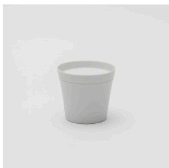
PN: IR/004 Name: Tea Cup M Color: White Matt Size: \phi 95 H85