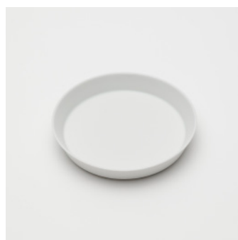
PN: IR/008 Name: Plate 160 Color: White Matt Size: \phi 165 H29