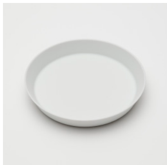
PN: IR/010 Name: Plate 210 Color: White Matt Size: \phi 210 H33