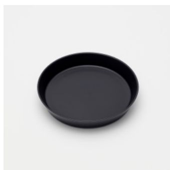
PN: IR/007 Name: Plate 160 Color: Black Matt Size: \phi 165 H29