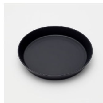
PN: IR/009 Name: Plate 210 Color: Black Matt Size: \phi 210 H33