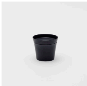
PN: IR/001 Name: Tea Cup S Color: Black Matt Size: \phi 75 H70