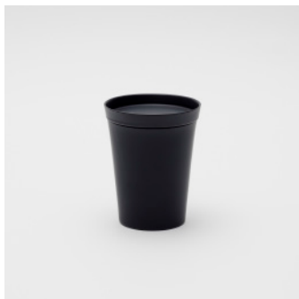
PN: IR/011 Name: Tea Container Color: Black Matt Size: \phi 107 H136