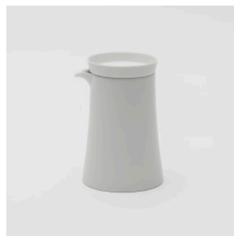
PN: IR/018 Name: Jug Color: White Matt Size: \phi 76 W90 H140