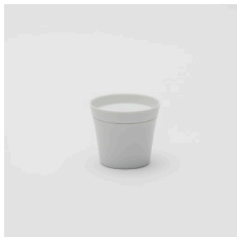
PN: IR/002 Name: Tea Cup S Color: White Matt Size: \phi 75 H70