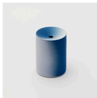
PN: KC/015 Name: Flower Vase S Color: Light Blue/Blue Size: \phi 85 H120