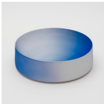
PN: KC/011 Name: Bowl 280 Color: Blue Size: \phi 276 H87