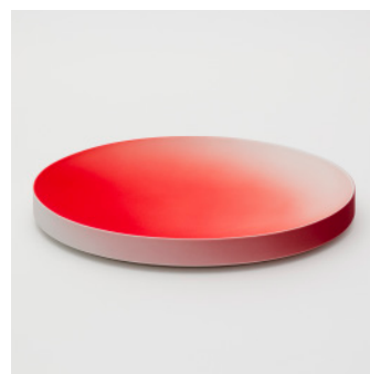
PN: KC/006 Name: Plate 310 Color: Red/Dark Red Size: W305 D210 H37