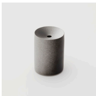
PN: KC/013 Name: Flower Vase S Color: Black/White Size: \phi 85 H120