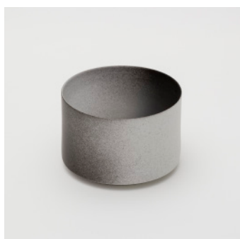
PN: KC/007 Name: Bowl 160 Color: Black/White Size: φ160 H107