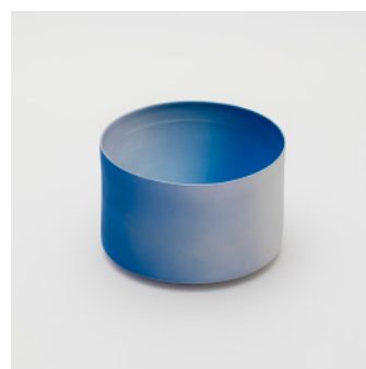
PN: KC/009 Name: Bowl 160 Color: Light Blue/Blue Size: φ160 H107