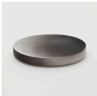
PN: KC/001 Name: Plate 220 Color: Black/White Size: W226 D157 H35