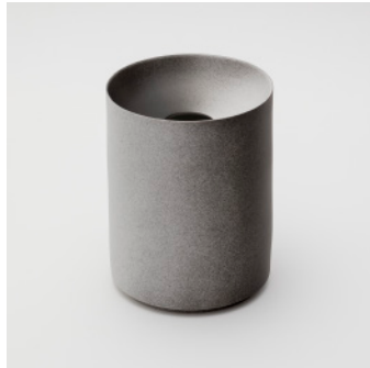
PN: KC/019 Name: Flower Vase L Color: Black/White Size: \phi 152 H200