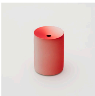
PN: KC/014 Name: Flower Vase S Color: Red Size: \phi 85 H120