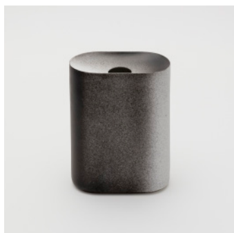
PN: KC/016 Name: Flower Vase M Color: Black/White Size: W135 D74 H185