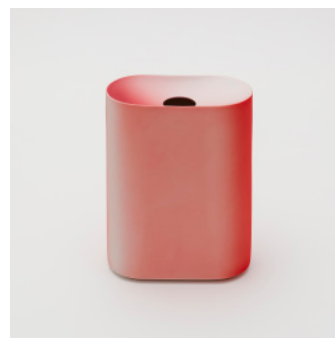
PN: KC/018 Name: Flower Vase M Color: Dark Red/Red Size: W135 D74 H185