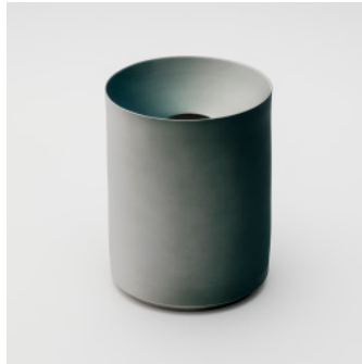
PN: KC/020 Name: Flower Vase L Color: Peacock Size: \phi 152 H200