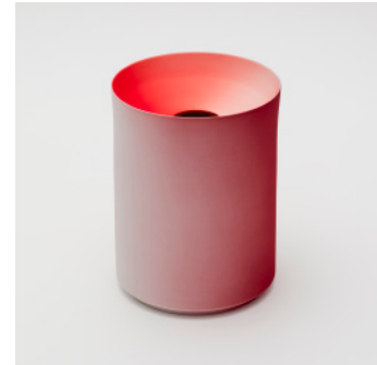
PN: KC/021 Name: Flower Vase L Color: Red/Dark Red Size: \phi 152 H200