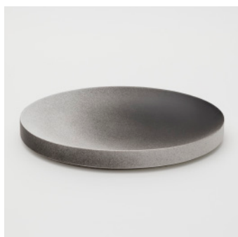
PN: KC/004 Name: Plate 310 Color: Black/White Size: W305 D210 H37