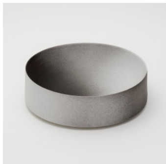
PN: KC/010 Name: Bowl 280 Color: Black/White Size: \phi 276 H87