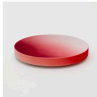
PN: KC/003 Name: Plate 220 Color: Dark Red/Red Size: W226 D157 H35