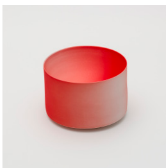
PN: KC/008 Name: Bowl 160 Color: Red Size: φ160 H107