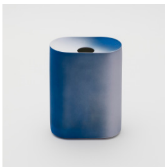
PN: KC/017 Name: Flower Vase M Color: Blue Size: W135 D74 H185