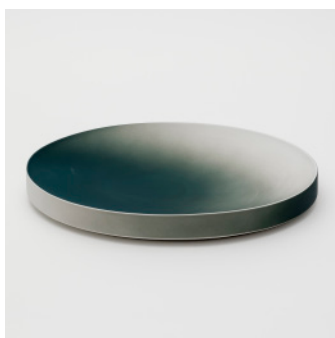
PN: KC/005 Name: Plate 310 Color: Peacock Size: W305 D210 H37