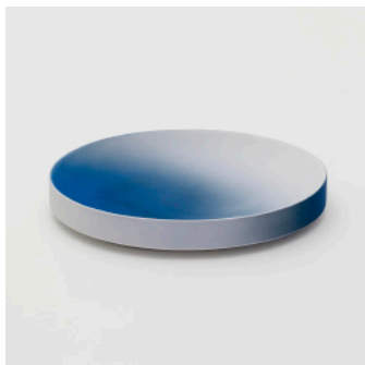
PN: KC/002 Name: Plate 220 Color: Blue Size: W226 D157 H35