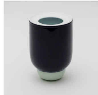
PN: PD/030 Name: Flower Vase L Color: White/Dark Blue/Celadon Size: \phi 160 H230