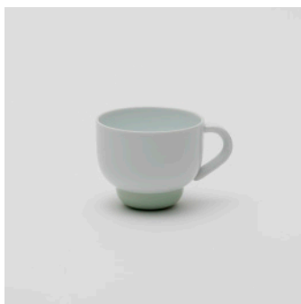
PN: PD/008 Name: Tea Cup Color: White/Celadon Size: \phi 92 W115 H75