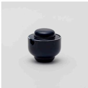
PN: PD/023 Name: Sugar Pot Color: Dark Blue Size: \phi 98 H100