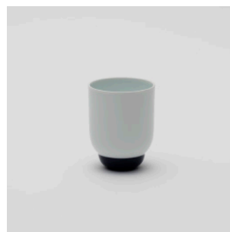
PN: PD/006 Name: Cup L Color: White/Dark Blue Size: \phi 78 H102