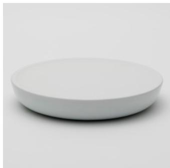
PN: PD/019 Name: Tray Color: White Size: \phi 260 H42