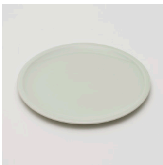
PN: PD/014 Name: Plate Color: Celadon Size: \phi 240 H25