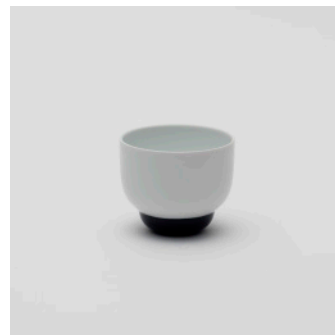
PN: PD/003 Name: Cup S Color: White/Dark Blue Size: \phi 90 H73