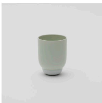
PN: PD/005 Name: Cup L Color: Celadon/White Size: \phi 78 H102