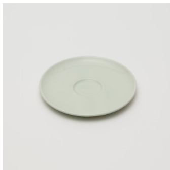
PN: PD/011 Name: Saucer Color: Celadon Size: \phi 150 H8