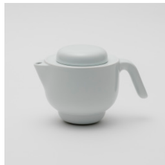
PN: PD/024 Name: Tea Pot Color: White Size: \phi 138 W215 H137