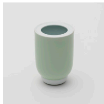
PN: PD/027 Name: Flower Vase S Color: White/Celadon/White Size: \phi 105 H150