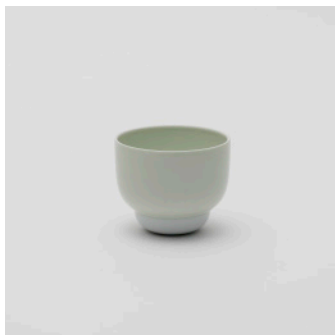
PN: PD/002 Name: Cup S Color: Celadon/White Size: \phi 90 H73