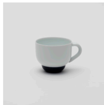
PN: PD/009 Name: Tea Cup Color: White/Dark Blue Size: \phi 92 W115 H75