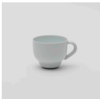
PN: PD/007 Name: Tea Cup Color: White Size: \phi 92 W115 H75