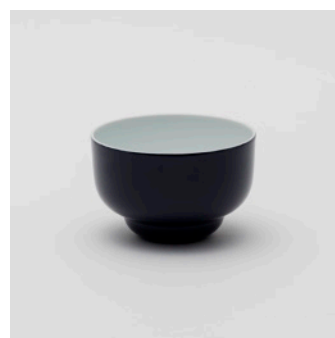
PN: PD/018 Name: Bowl 120 Color: Dark Blue Size: \phi 125 H80