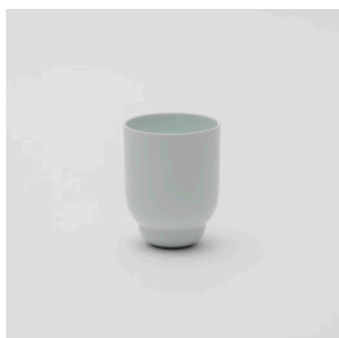
PN: PD/004 Name: Cup L Color: White Size: \phi 78 H102