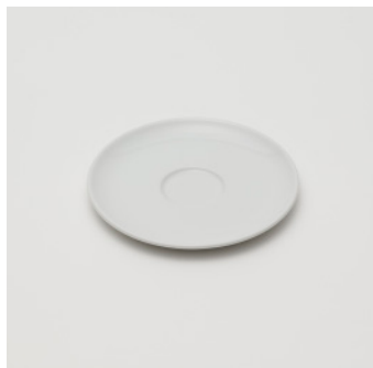
PN: PD/010 Name: Saucer Color: White Size: \phi 150 H8