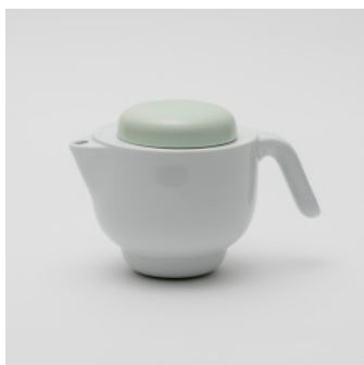
PN: PD/026 Name: Tea Pot Color: Celadon/White Size: \phi 138 W215 H137