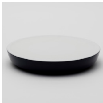
PN: PD/020 Name: Tray Color: Dark Blue Size: \phi 260 H42