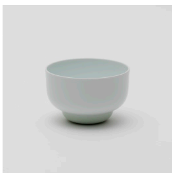
PN: PD/017 Name: Bowl 120 Color: White/Celadon Size: \phi 125 H80