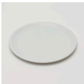
PN: PD/013 Name: Plate Color: White Size: \phi 240 H25