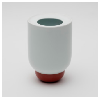
PN: PD/031 Name: Flower Vase L Color: White/White/Red Size: \phi 160 H230