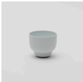
PN: PD/001 Name: Cup S Color: White Size: \phi 90 H73