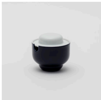
PN: PD/022 Name: Sugar Pot Color: White/Dark Blue Size: \phi 98 H100