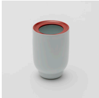
PN: PD/028 Name: Flower Vase S Color: Red/White/White Size: \phi 105 H150