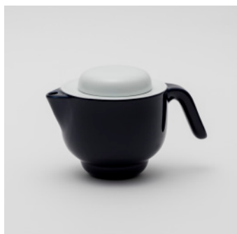
PN: PD/025 Name: Tea Pot Color: White/Dark Blue Size: \phi 138 W215 H137