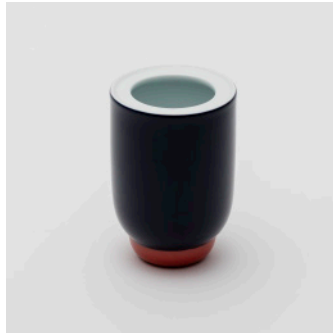
PN: PD/029 Name: Flower Vase S Color: White/Dark Blue/Red Size: \phi 105 H150