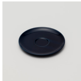
PN: PD/012 Name: Saucer Color: Dark Blue Size: \phi 150 H8