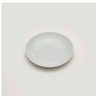
PN: SD/005 Name: Plate 110 Color: White Size: \phi 105 H16