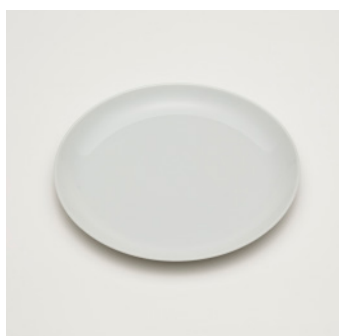
PN: SD/007 Name: Plate 200 Color: White Size: \phi 203 H16