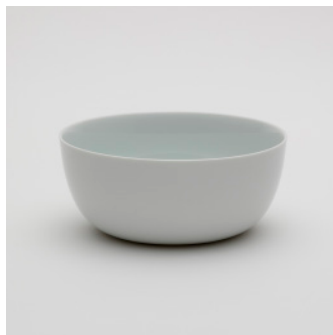
PN: SD/014 Name: Bowl 200 Color: White Size: \phi 200 H85