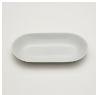
PN: SD/016 Name: Oval Bowl 230 Color: White Size: W230 D125 H35