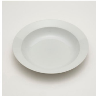
PN: SD/011 Name: Deep Plate 250 Color: White Size: \phi 245 H40