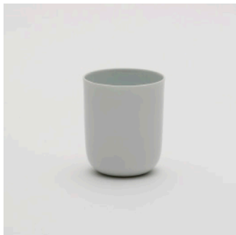
PN: SD/002 Name: Cup L Color: White Size: \phi 78 H90