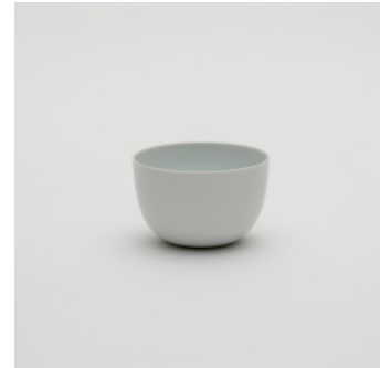
PN: SD/012 Name: Bowl 110 Color: White Size: \phi 105 H65