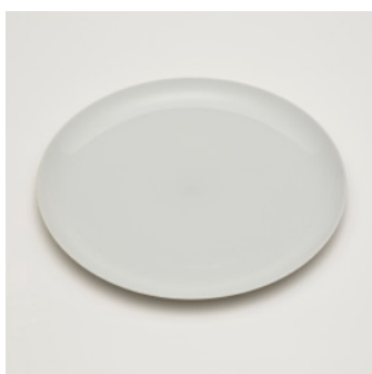
PN: SD/008 Name: Plate 260 Color: White Size: \phi 260 H18