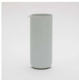
PN: SD/025 Name: Pitcher Color: White Size: \phi 100 H215