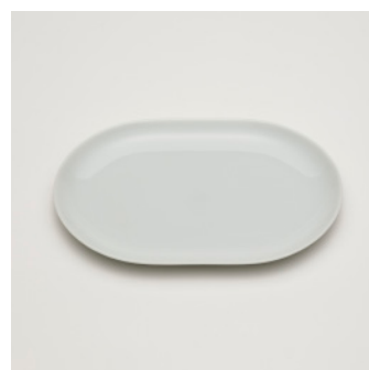
PN: SD/009 Name: Oval Plate 240 Color: White Size: W240 D170 H15