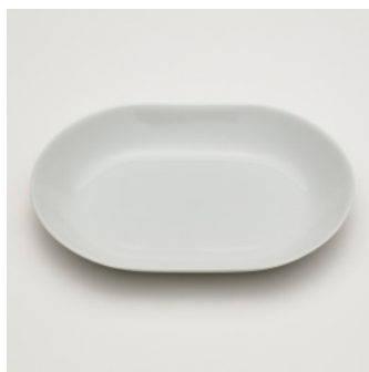
PN: SD/017 Name: Oval Bowl 250 Color: White Size: W245 D174 H35