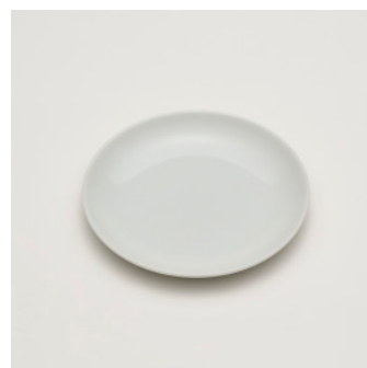
PN: SD/006 Name: Plate 140 Color: White Size: \phi 140 H16