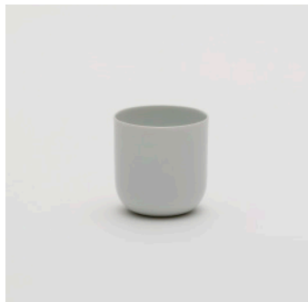
PN: SD/001 Name: Cup S Color: White Size: \phi 65 H65