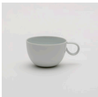
PN: SD/004 Name: Coffee Cup Color: White Size: \phi 95 W127 H60