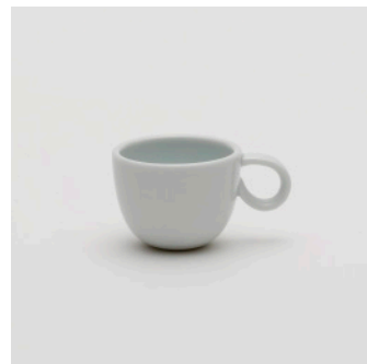
PN: SD/003 Name: Espresso Cup Color: White Size: \phi 60 W82 H45