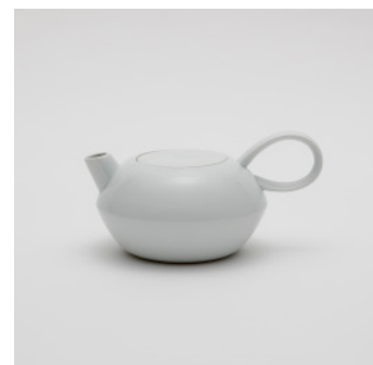
PN: SD/018 Name: Tea Pot S Color: White Size: \phi 148 W205 H105