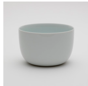
PN: SD/015 Name: Serving Bowl 200 Color: White Size: \phi 200 H127