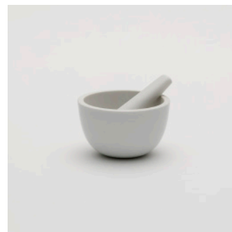
PN: SD/021 Name: Mortar Color: White Size: \phi 100 H58