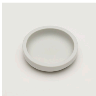
PN: SD/023 Name: Salt Saucer Color: White Size: \phi 80 H20