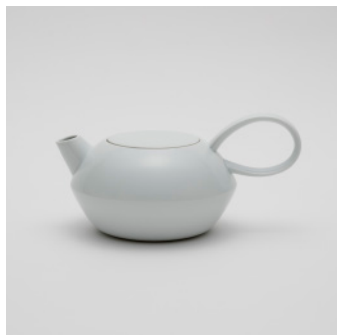
PN: SD/019 Name: Tea Pot L Color: White Size: \phi 182 W263 H125