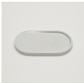
PN: SD/020 Name: Grater Color: White Size: W180 D100 H18