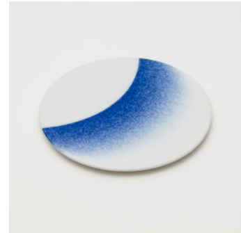
PN: WS/003 Name: Plate 180 Color: Spray Size: \phi 178 H10