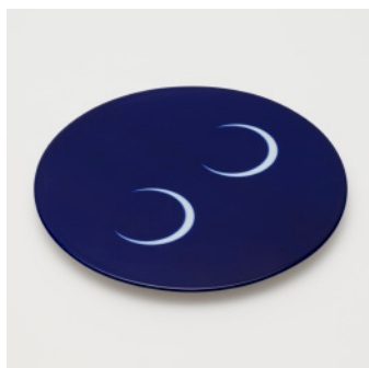
PN: WS/016 Name: Sugar/Milk Pot Tray Color: Mask Size: \phi 230 H16