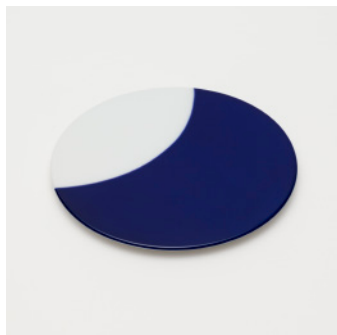
PN: WS/004 Name: Plate 180 Color: Mask Size: \phi 178 H10