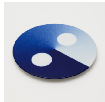
PN: WS/015 Name: Sugar/Milk Pot Tray Color: Spray Size: \phi 230 H16