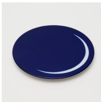
PN: WS/008 Name: Cake Tray Color: Mask Size: \phi 230 H16