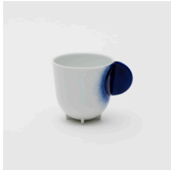
PN: WS/001 Name: Tea Cup Color: Spray Size: \phi 75 W100 H75