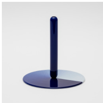
PN: WS/005 Name: Flower Vase Color: Spray Size: \phi 200 H205