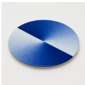
PN: WS/007 Name: Cake Tray Color: Spray Size: \phi 230 H16