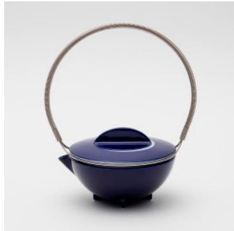
PN: WS/010 Name: Tea Pot Color: Mask Size: \phi 160 W180 H180