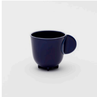
PN: WS/002 Name: Tea Cup Color: Mask Size: \phi 75 W100 H75