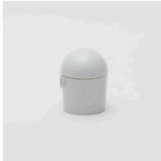
PN: WS/011 Name: Milk Pot Color: Spray Size: \phi 67 H80