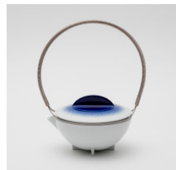
PN: WS/009 Name: Tea Pot Color: Spray Size: \phi 160 W180 H180