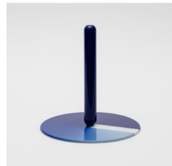
PN: WS/006 Name: Flower Vase Color: Mask Size: \phi 200 H205