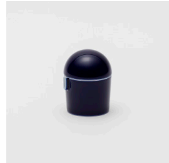
PN: WS/012 Name: Milk Pot Color: Mask Size: \phi 67 H80